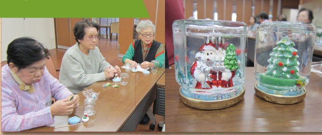
12月はスノードームを作りました