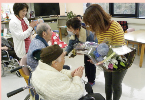
家族会より花束贈呈