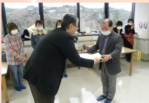
施設より感謝状・お礼品の贈呈