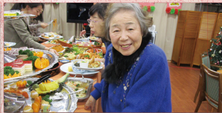
バイキングを楽しみました