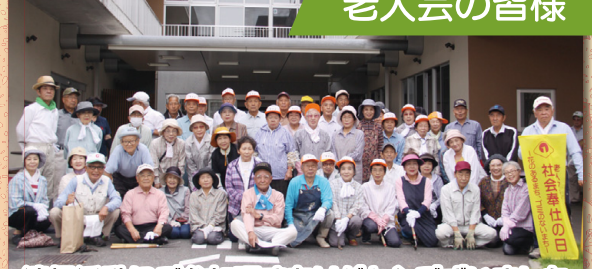
清掃活動にご参加頂きありがとうございました