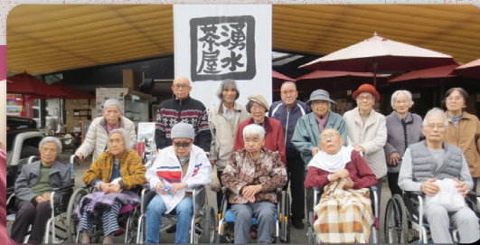
記念写真をパチリ☆