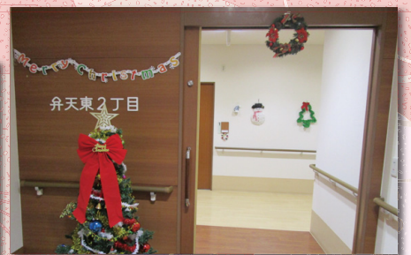
各ユニット毎に飾り付けをしています